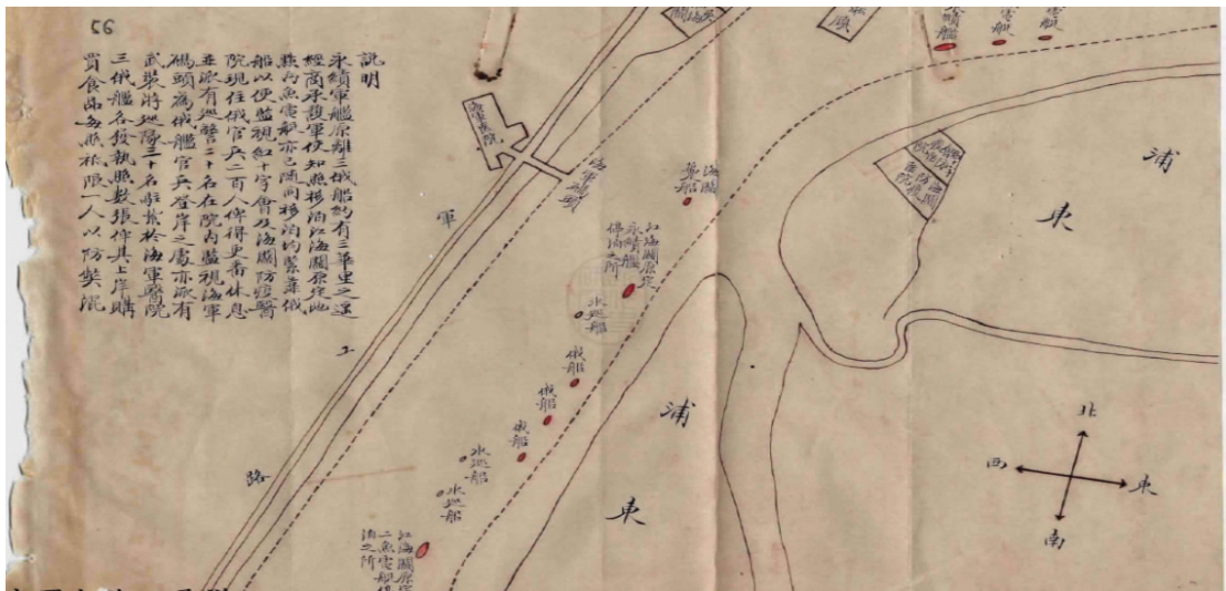
图1 俄舰与中国海军僵持情形

泊后销卖军械,“浙江地方官曾亲临购买并保护白军……又在吴淞口将所载之军械卖于一中国某军长” [1] 。尽管苏俄代表一再抗议,要求将俄舰问题交由中俄双方会议讨论决定其归属 [2] ,但俄舰官兵不愿回国,遂与中国海军在吴淞江面形成对峙,图1为俄舰停泊与中国军舰监视位置情形。